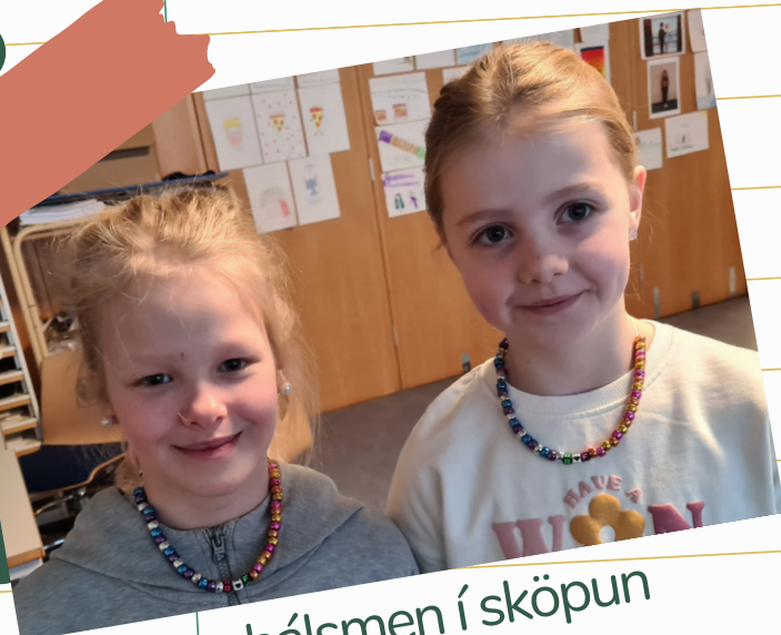
Vinahálsmen í sköpun

Matseðill: 10. bekkur hefur valið kjúklinga- og beikonpasta.